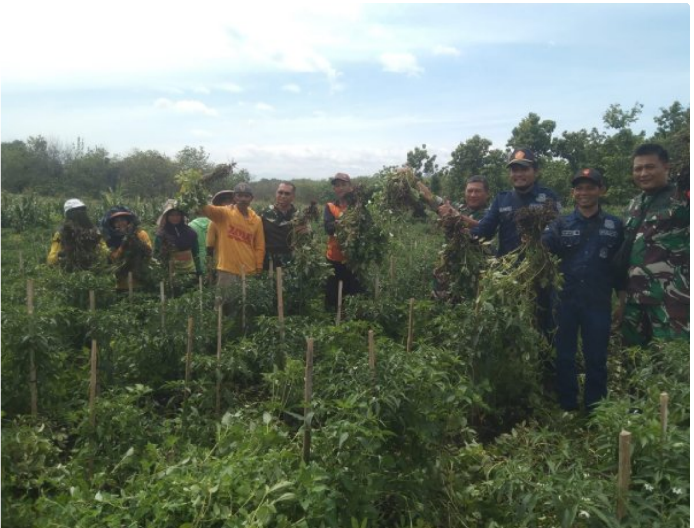
Dandim 0804/Magetan Bersama Dinas Perhutani Melaksanakan Peninjauan Perluasan Area Tanam