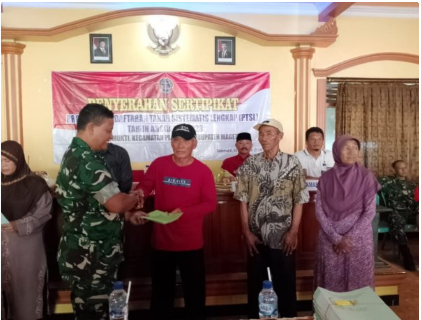
Danramil 0804/02 Plaosan Hadiri Penyerahan Sertifikat Program Pendaftaran Tanah Sistematis Lengkap (PTSL) Desa Sidomukti

PLAOSAN. - Desa Sidomukti melalui Badan Pertanahan Nasional (BPN) melakukan penyerahan Sertifikat Tanah Program Pendaftaran Tanah Sistematis