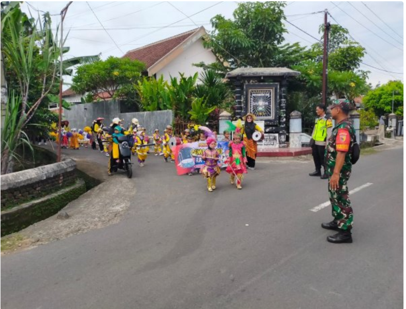
Gebyar Rojabiyah RA dan MI, Babinsa bersama Bhabinkamtibmas Amankan Jalannya Kegiatan Parade Drum Band